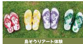
島ぞうりアート体験