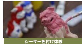
シーサー色付け体験

※刃物を使用するので、保護者同伴でご参加ください ※ご予約の際は、足のサイズをお知らせください。 ※雨天時可能 ※作品は持ち帰る事ができます。