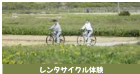
レンタサイクル体験