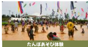
たんぼあそび体験