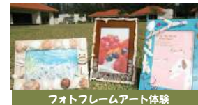
フォトフレームアート体験

※体験は1人1セット(オス・メス)となっております。 ※雨天時可能 ※作品は持ち帰る事ができます。